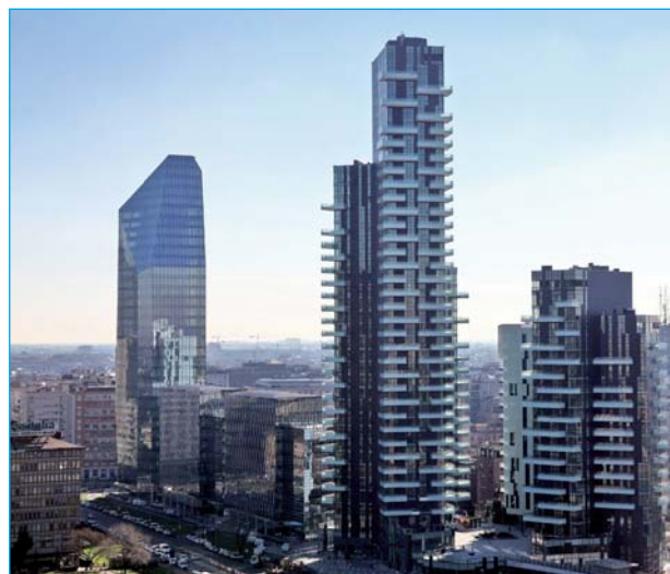
SEDE CELGENE ITALIA

La modernizzazione del Sistema Sanitario in Italia, negli ultimi anni, ha prodotto dei forti cambiamenti, legati in particolar modo alla ricerca di un nuovo modello di sostenibilità, che ha avuto un forte impatto sulla gestione delle strutture sanitarie e, quindi, sui pazienti. È sempre più necessario, infatti, riuscire a coniugare la sostenibilità dei costi con la qualità dell'assistenza, per poter garantire che i pazienti ricevano le cure migliori. Questo sforzo include tutte le figure coinvolte nell'ambito della salute, quali dirigenti, medici, farmacisti ospedalieri e le aziende farmaceutiche, che devono agire in sinergia per garantire un uso sicuro del farmaco, ottimizzando l'appropriatezza e l'aderenza alla terapia, attraverso un miglioramento del processo di valutazione, acquisizione, prescrizione e uso razionale dei farmaci.